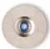
Cepillo cerda blanca y negra pulidor Cabra blanco