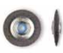
Cepillo circular cerda negra Chungking negra dura