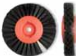
Cepillo circular cerda negra tipo G Cerde negra chungking