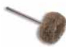
Disco montado scotch-brite duro Scotch-brite duro