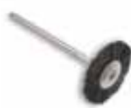
Cepillo montado chungking negra Chungking negra dura