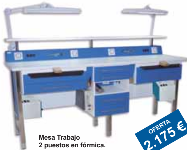
Mesa Trabajo 2 puestos en fórmica.