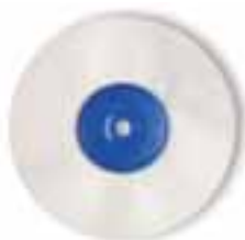
Cepillo paño zeta para brillo Paño zeta