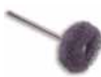
Disco montado scotch-brite fino Scotch-brite fino