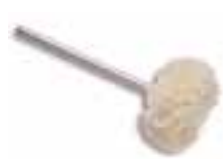
Borrego montado algodón Hilo algodón grueso espesor normal