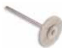
Cepillo montado pelo cabra Pelo cabra blanco blando