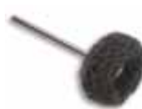
Disco montado scotch-brite medio Scotch-brite medio