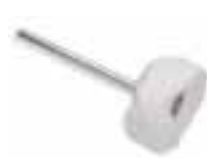
Cepillo montado paño franela Paño franela