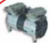
SR 805 Bomba de vacío