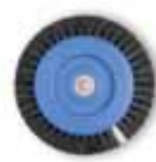
Cepillo circular cerda negra tipo S Cerde negra chungking