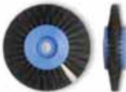
Cepillo circular cerda negra tipo S Cerde negra chungking