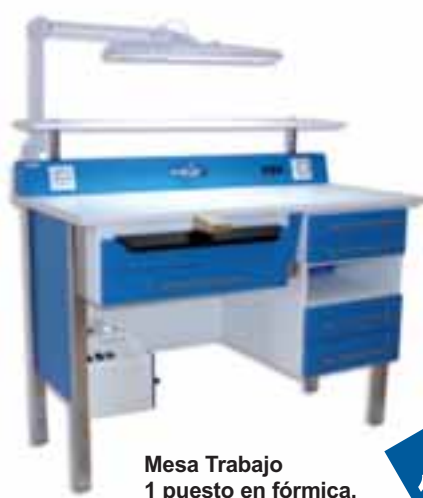
Mesa Trabajo 1 puesto en fórmica.