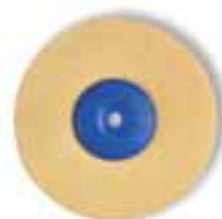
Cepillo cuero de microfibras Cuero microfibras