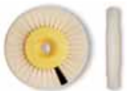
Cepillo cerda blanca y negra pulidor Cabra y scotch brite